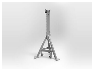
MS08LR Chandelle, 8,2 T, 790-1270 mm