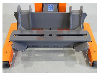
EHB907TRT412TR01-50 0 Traverse de base 800 mm, pour le tracteur à l'avant