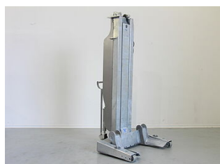
EHB907DC01-H-VZ Galvanisation pour colonne EHB90xDC