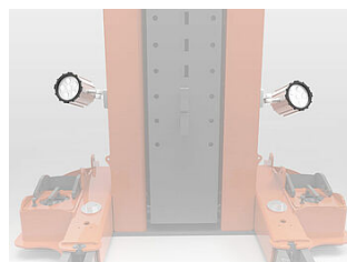
EHB907SPOT02 2 spots LED