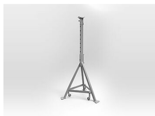
HS08LR Chandelle, 8,2 T, 1260-1990 mm