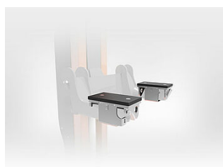
EHB907-LS-PR503-500 Support de charge, accrochable