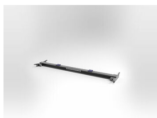
EHB905TR113500 Traverse, 11 T, longueur 3500 mm