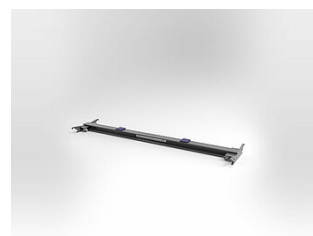
EHB905TR113000 Traverse, 11 T, longueur 3000 mm