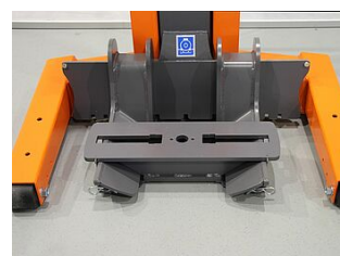
EHB907TRT412TR02-50 0 Traverse de base 640 mm, pour le tracteur à l'arrière